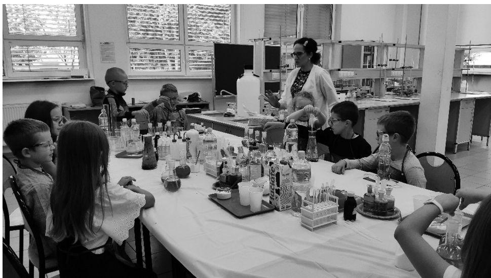
Fot. 5. Zajęcia „Chemia w domu”