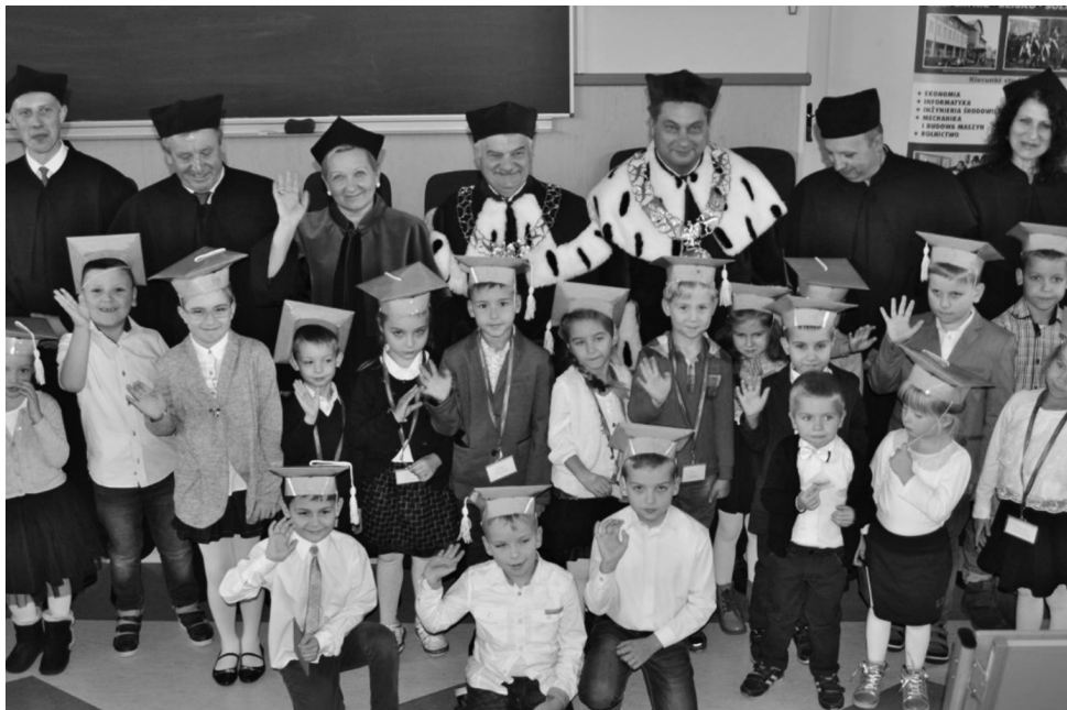
Fot. 1. Uroczysta inauguracja roku akademickiego 2016/2017