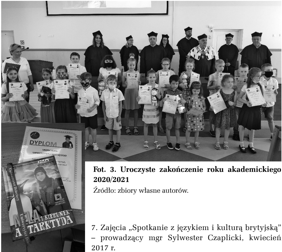
Fot. 3. Uroczyste zakończenie roku akademickiego 2020/2021