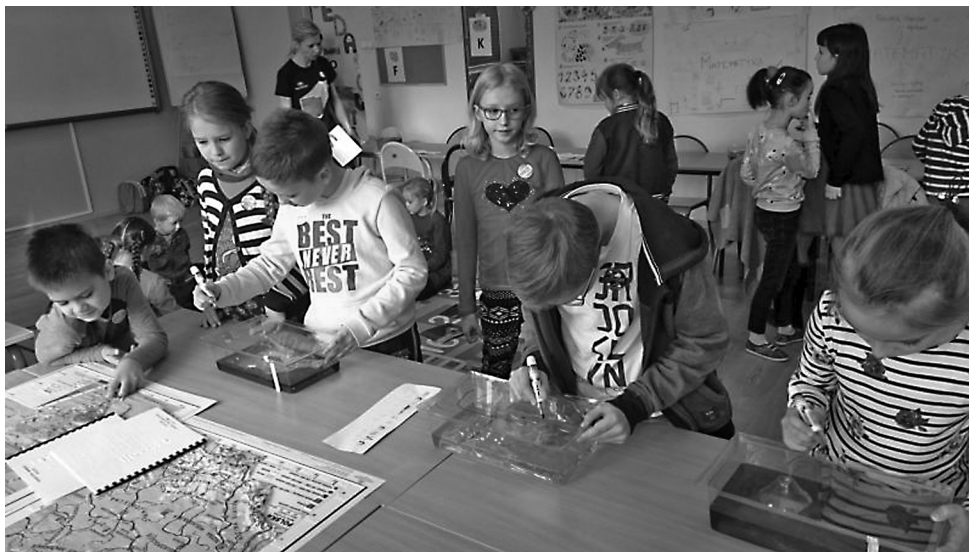
Fot. 4. Zajęcia „Ziemia czy ziemniak – rzecz o geodezji i kartografii”