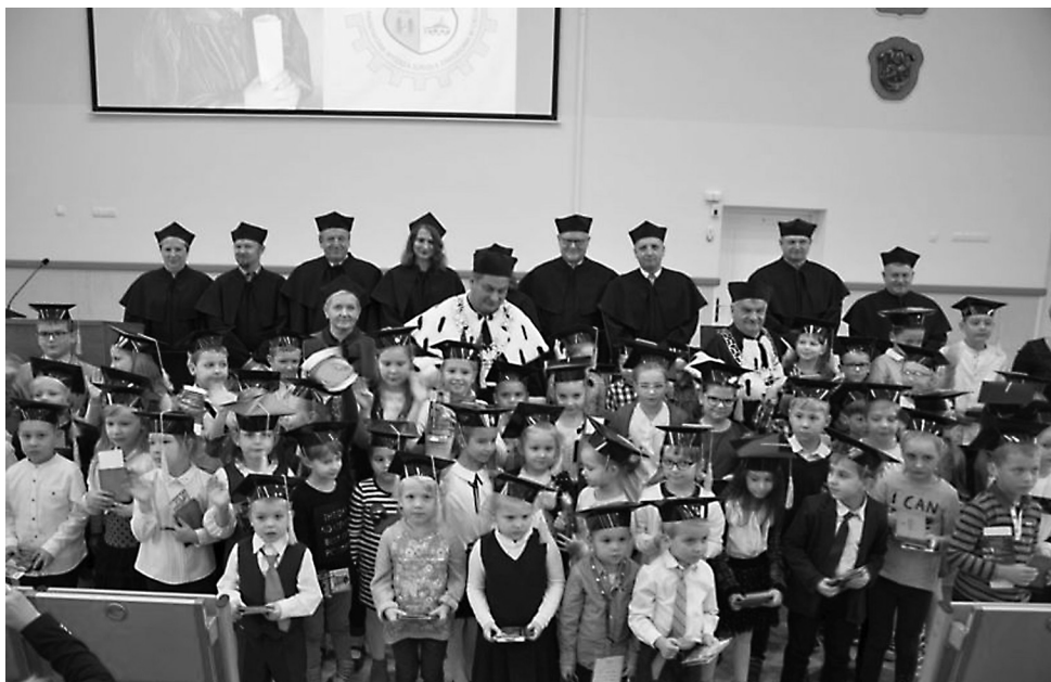
Fot. 2. Uroczysta inauguracja roku akademickiego 2017/2018