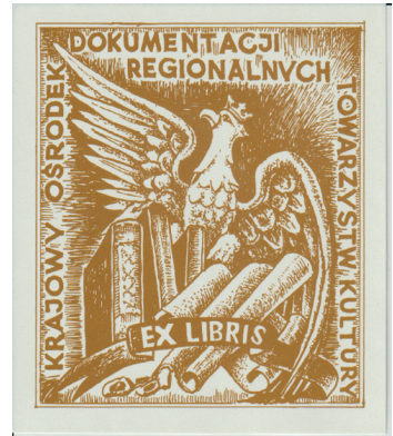
Ryc. Znak graficzny KODRTK (ex libris)

Jak pisał A. Kociszewski – dyrektor KODRTK – we wszystkich działaniach Rady Krajowej Ruchu Towarzystw Regionalnych 5 uczestniczyło oficjalnie Ciechanowskie Towarzystwo Naukowe, angażując się nie tylko w sprawy organizacyjne, ale także w większość przedsięwzięć wydawniczych. Jednym ze znaczących efektów angażowania się CTN w działalność merytoryczną Ruchu Towarzystw Regionalnych było opracowanie części Raportu o stanie kultury wiejskiej w Polsce , poświęconej północnemu Mazowszu 6 . Raport był przedmiotem obrad Krajowego Kongresu Kultury Wsi (na Jasnej Górze w dniach 20–23 kwietnia 1997 r.). Po tym wydarzeniu Ciechanowskie Towarzystwo Naukowe otrzymało kilka kolejnych zleceń, również badawczych, związanych z tematem Samodzielność kulturowa wsi i wartości kultury tradycyjnej . Między innymi opracowanie dokumentacji przyznawanej od kilkunastu lat Nagrody im. Oskara Kolberga . W 1997 r. Krajowy Ośrodek Dokumentacji Regionalnych Towarzystw Kultury został oficjalnie