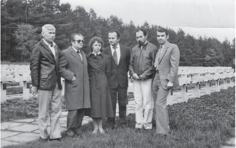
Fot. A. Kociszewski (pierwszy z prawej) z grupą pisarzy węgierskich na cmentarzu w Palmirach (1986 r.)