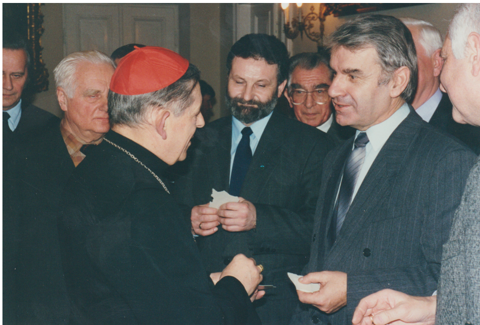
Fot. Aleksander Kociszewski z ks. prymasem Polski kard. Józefem Glempem na ogólnopolskim spotkaniu regionalistów (Warszawa, grudzień 1996 r.)