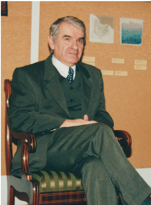
Fot. A. Kociszewski w czasie wręczenia nagrody im. F. Rajkowskiego (Laur ciechanowski)