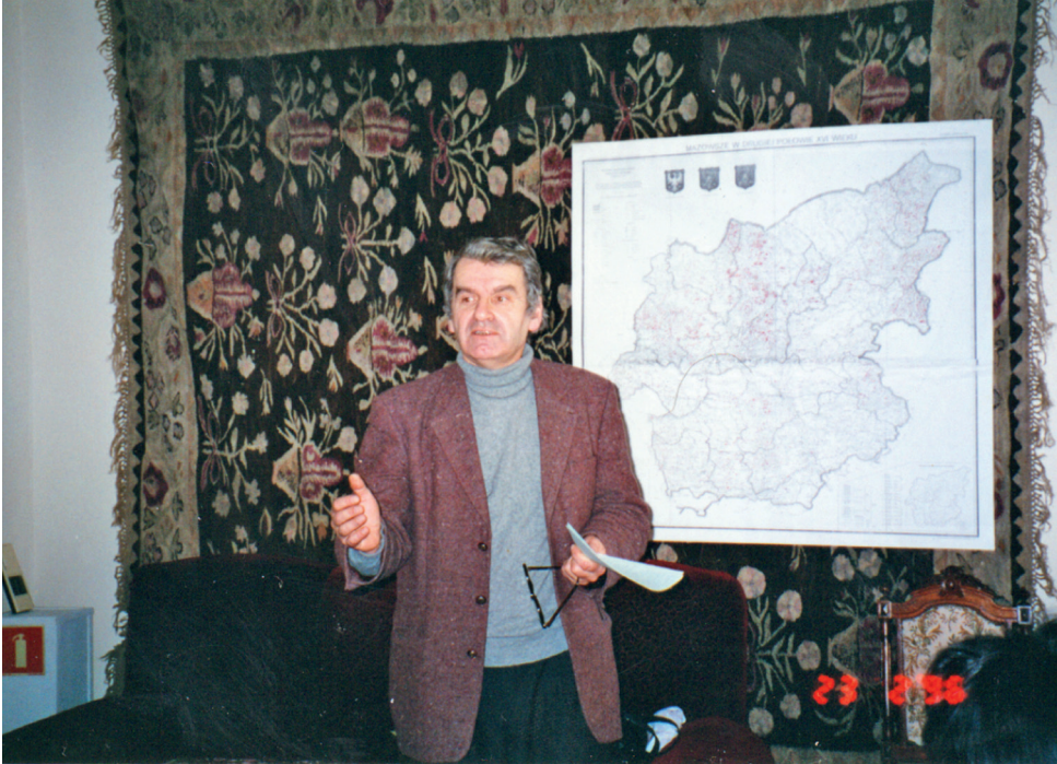
Fot. A. Kociszewski w czasie jednej z prelekcji w Muzeum Szlachty Mazowieckiej