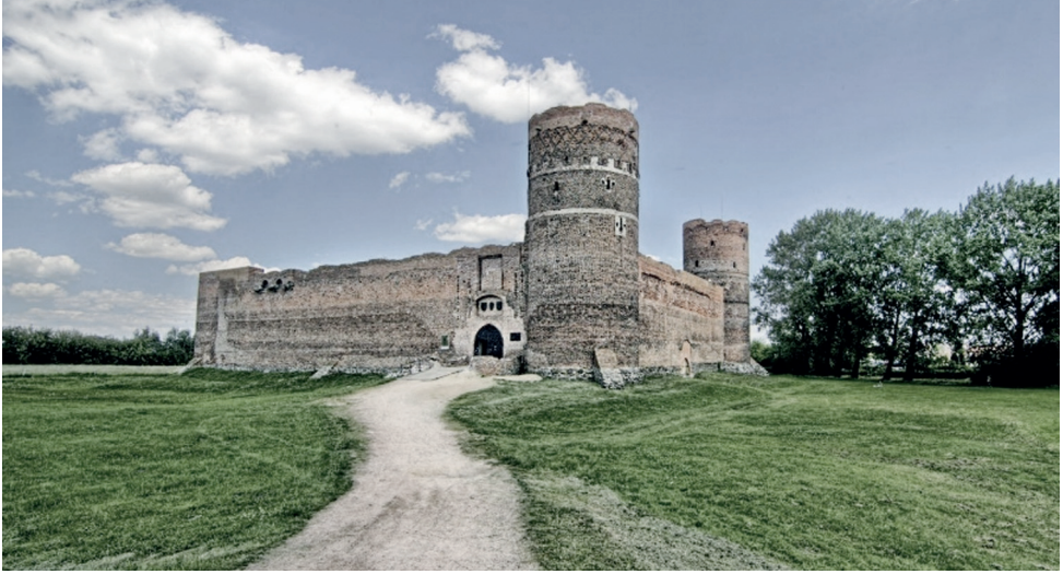
Fot. Zamek w Ciechanowie pod koniec lat 70. XX w.