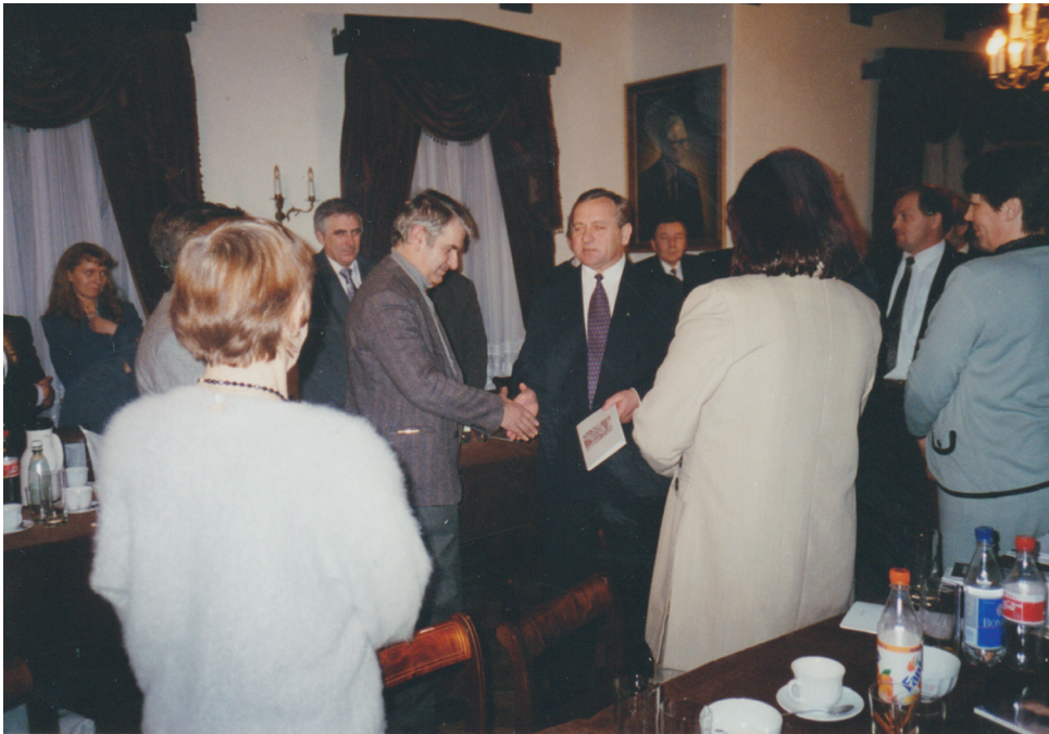
Fot. Minister kultury i sztuki Zdzisław Podkański informuje o wpisaniu KODRTK w Ciechanowie na listę Narodowych Instytucji Kultury